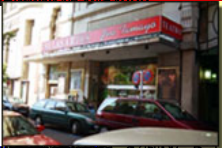
http://www.elpais.com/ a las 21 h30 a 13.30 h.