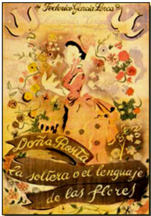
Cartel del estreno

de Margarita Xirgu. HASTA este año "Doña Rosita Xirgu ha