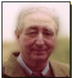
Jerónimo López Mozo