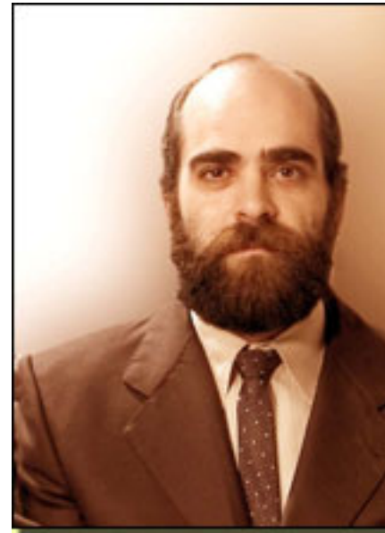
LUIS TOSAR (TOM, en la foto encarna al Padre)

haya escogido este texto para subir por primera vez a un escenario de nuestro país, tras quince años de residencia en él dedicada a la formación de jóvenes actores.