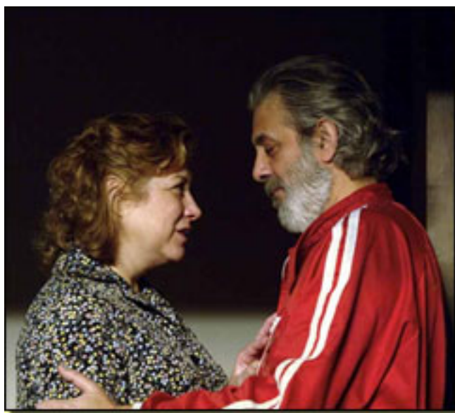
MERECÈ ARENAGA/CHETE LERA

Y es que Largo viaje... es un desvelar su vida anterior familiar y una sincera confesión que consigue echar los demonios familiares fuera.