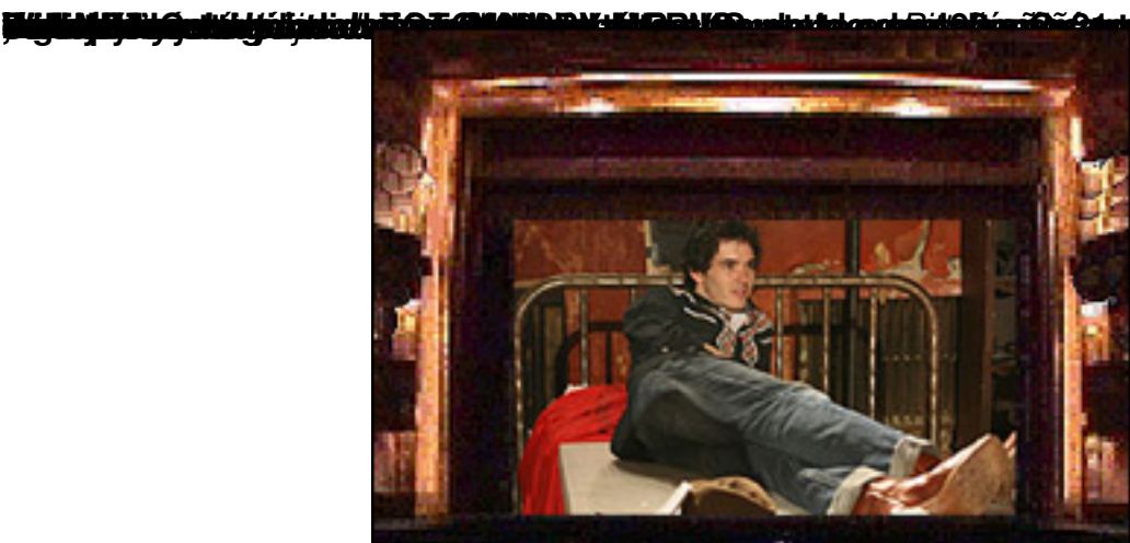
Billy the Kid (© Billy el Niño En)