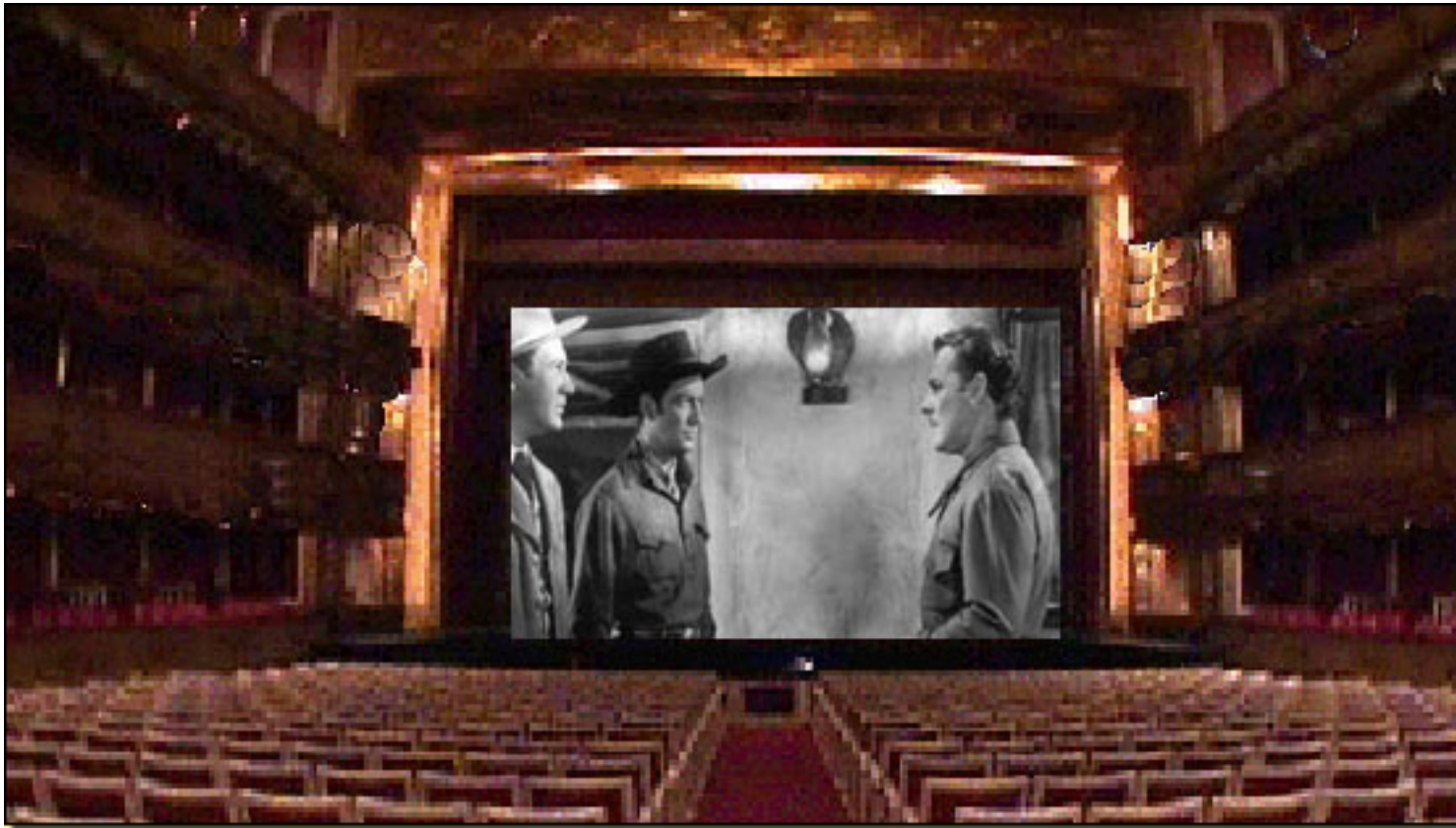
Billy the Kid (1941) - David Miller (DIRECTOR), Frank Borzage, Robert Taylor

Viernes, 19 de Marzo de 2010 18:39 - Actualizado Jueves, 29 de Abril de 2010 14:16