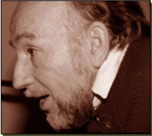
ADOLFO MARSILLACH

Viernes, 19 de Marzo de 2010 06:57 - Actualizado Sábado, 27 de Junio de 2020 16:40