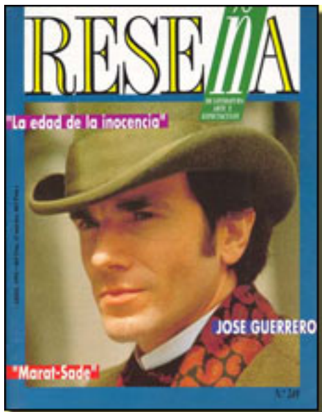
RESEÑA, 1994 NUM. 249, pp. 3

Sábado, 27 de Marzo de 2010 15:20 - Actualizado Sábado, 01 de Mayo de 2010 08:17