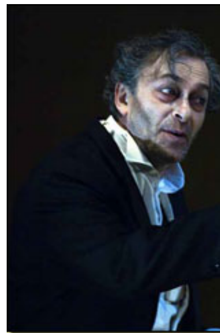
HELIO PEDREGAL

■ Un grupo de gánsters secuestra a la heredera de un millonario estadounidense en la séptima planta de un hotel de lujo con el propósito de pedir un rescate, pero sucede algo imprevisto. Cuando la policía tiene rodeado el edificio, uno de los pistoleros asesina a la rehén, lo que despeja el camino de los sitiadores para poner fin al violento suceso. Pero antes de que se produzca el asalto, una estratagema permite aplazar el desenlace: uno de los secuestradores se viste con las ropas de la mujer muerta y se pasea frente al balcón haciéndose pasar por ella. Esta historia, inspirada en un hecho real del que se hizo eco la prensa de la época, da para una buena novela negra, un trepidante thriller cinematográfico o, en el caso que nos ocupa, una comedia de acción. Genet se sirvió de ella para otra cosa. Aprovechó el largo encierro de los personajes para alternar los momentos de tensión provocada por una situación cuyo desenlace conduce a una muerte segura o a su rendición, con otros, en los que, como si su destino hubiera dejado de preocuparles, dan rienda suelta a sus fantasías. Dos de ellos, bailan sobre las alfombras de aquel escenario de lujo, como si fueran privilegiados clientes que participan en una fiesta.