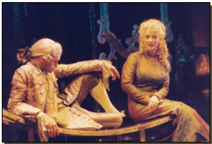
TONI CANTÓ/ AMPARO LARRAÑAGA

Sábado, 27 de Marzo de 2010 18:31 - Actualizado Jueves, 29 de Abril de 2010 16:24