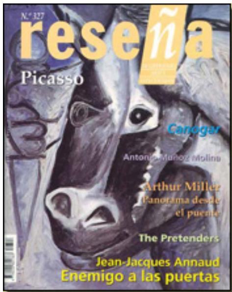
RESEÑA, 2001 NUM. 327 PP. 30

Sábado, 27 de Marzo de 2010 18:31 - Actualizado Jueves, 29 de Abril de 2010 16:24