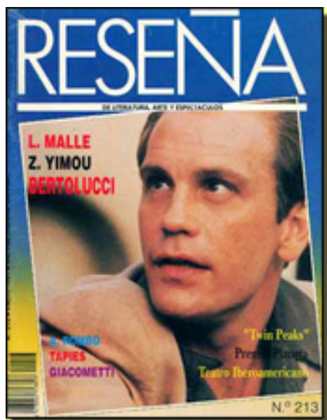
RESEÑA, 1991 NUM. 213 PP. 20

Sábado, 27 de Marzo de 2010 18:38 - Actualizado Jueves, 29 de Abril de 2010 16:18