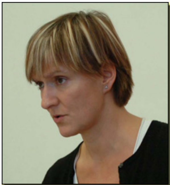
DEBORA WARNER

No es necesario insistir en que un texto semejante requiere ante todo una extraordinaria actriz. La precisión de un texto que carece casi por completo de desplazamientos por el escenario y de lo que tradicionalmente se concibe como acción, y que recurre a una palabra no dialógica hace descansar por completo la responsabilidad del espectáculo en la actriz que encarna a