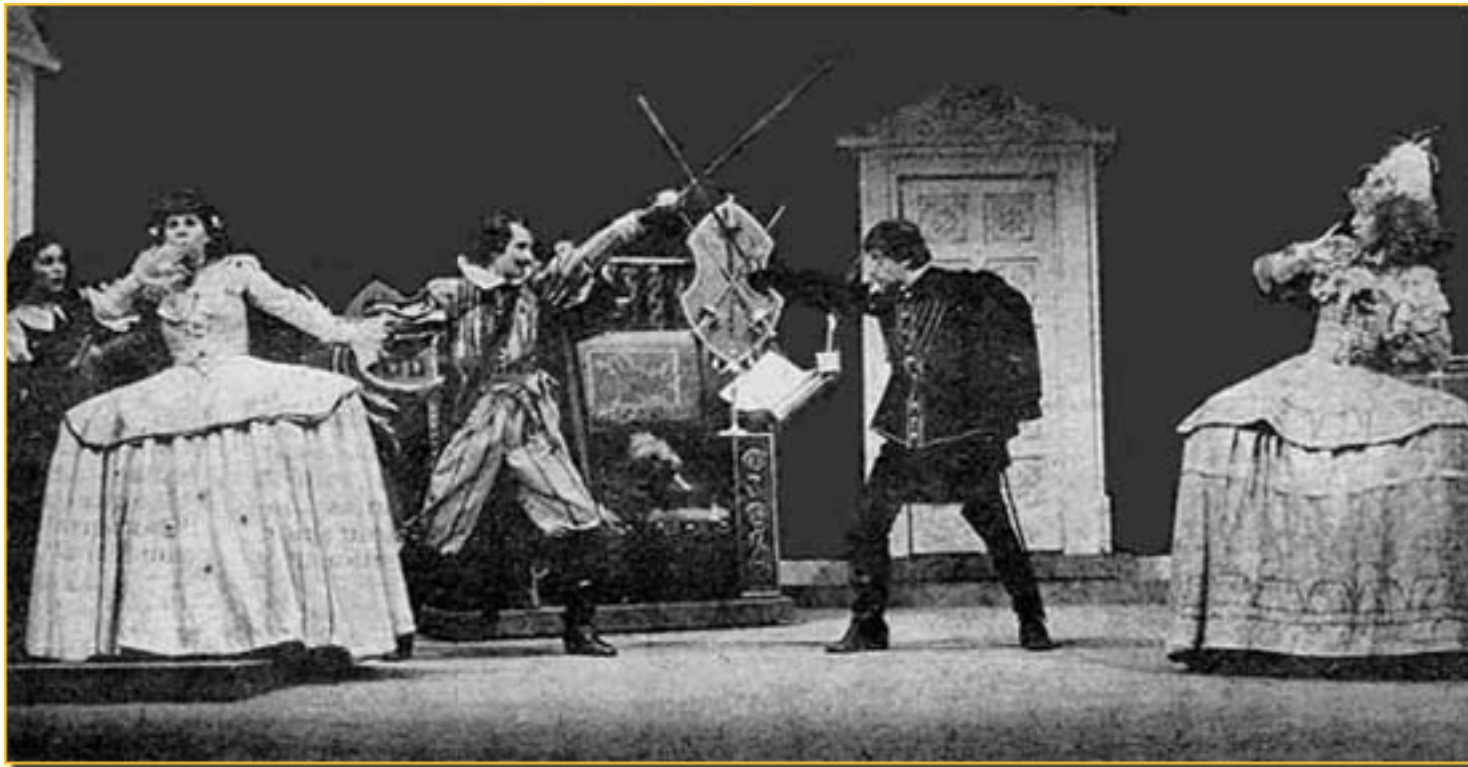
CASA CON DOS PUERTAS □ (ANTIGUA VERSIÓN DE LA COMPAÑÍA)

Sábado, 13 de Marzo de 2010 08:58 - Actualizado Jueves, 29 de Abril de 2010 16:54