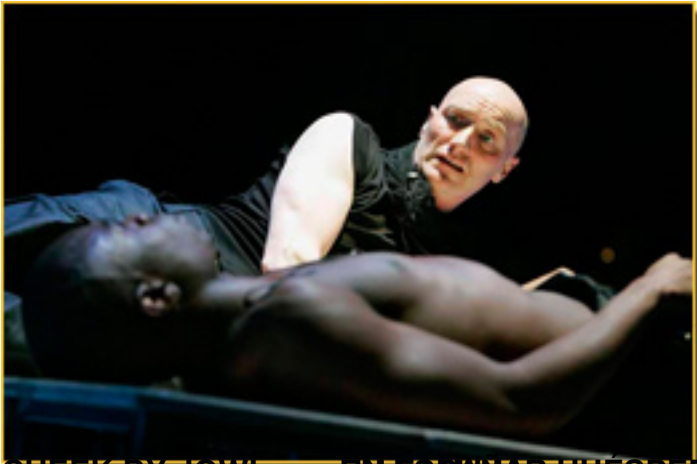
CHEEK BY JOWL, EN EL AMNAR HUESPED

Domingo, 14 de Marzo de 2010 12:31 - Actualizado Sábado, 15 de Mayo de 2010 10:13