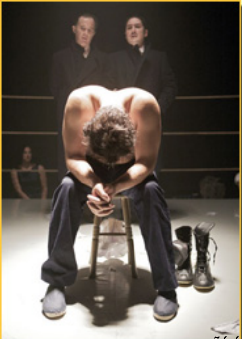
El actor Urtain en una escena de la obra 'El hombre que se volvió perro' de Alberto

Sábado, 20 de Marzo de 2010 17:09 - Actualizado Lunes, 12 de Julio de 2010 06:02