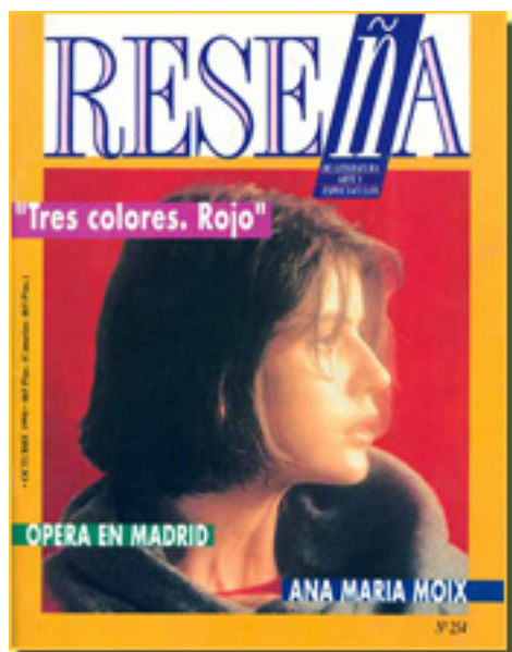
RESEÑA, 1994 NUM. 254, pp. 21-22

Sábado, 03 de Abril de 2010 17:53 - Actualizado Sábado, 01 de Mayo de 2010 19:49