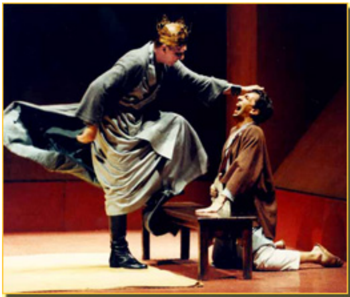
HÉCTOR COLOMÉ/AITOR TEJADA