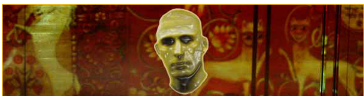
con motivo del Festival de Otoño

, en francés -, o al menos lo había olvidado, a sentirme bombardeado por este enigmático vocablo.