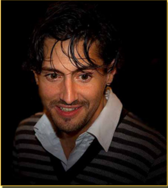
JUAN DIEGO BOTTO

Sábado, 20 de Marzo de 2010 18:11 - Actualizado Domingo, 31 de Mayo de 2020 16:18