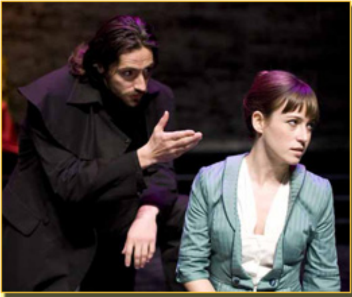
JUAN DIEGO BOTTO/MARTA ETURA

Sábado, 20 de Marzo de 2010 18:11 - Actualizado Domingo, 31 de Mayo de 2020 16:18