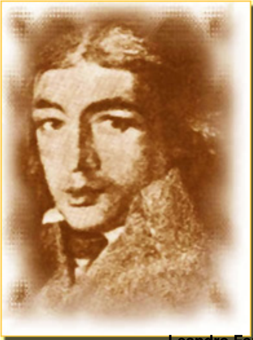
Leandro Fernández de Moratín, FERNÁNDEZ DE MORATÍN, Leandro Fernández de Moratín

Sábado, 20 de Marzo de 2010 18:42 - Actualizado Sábado, 10 de Julio de 2010 16:26